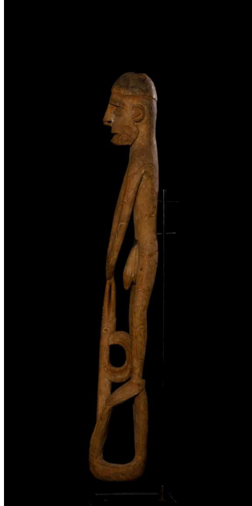
Scultura raffigurante un antenato del popolo Asmat. [Indonesia, Papua, XX secolo. Collezione Brignoni].