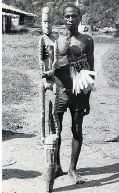
Fig. 4. Uomo Asmat con una scultura raffigurante un kawe .

e con una coda di opossum ( fachep ). Oceania. Melanesia. Asmat. Area nord-occidentale. Unir Siran. 1950-1960. Legno e pigmenti.