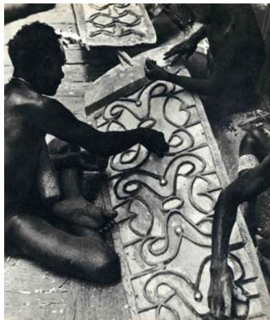
Fig. 7. Pittura collettiva di uno scudo yemes . Foto di T. Saulnier, 1959.

Oceania. Melanesia. Asmat. Area nord-occidentale. Emari Ducur. Prima metà del XX sec. Legno, fibre vegetali e pigmenti naturali.