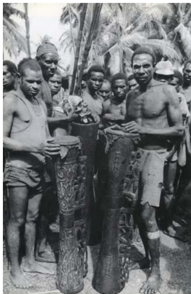
Fig. 8. Uomini Asmat con tamburi a clessidra em .

21. Oc.Mel. 1.360.Br. Decorazione scolpita del manico di un remo ( pu ) raffigurante tre code di opossum ( fachep ) e una testa di cacatua nero ( ufir ). Oceania. Melanesia. Asmat. Area centrale. Bismam. Circa 1960. Legno.