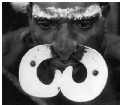
Fig. 6. Ornamento nasale ( bipanew ) perforante il setto. 1959.

11. Oc.Mel.1.362.Br Yemes oppure yamasj . Scudo da guerra interamente decorato da motivi bipanew , dei quali quattro coppie stilizzano il profilo di un antenato. La sommità raffigura una razza ( puru ). Oceania. Melanesia. Asmat. Area nord-occidentale. Emari Ducur. 1950-1960. Legno, fibre vegetali e pigmenti.