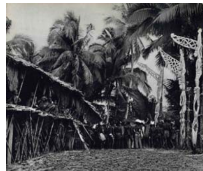
Fig. 9. Pali bis eretti di fronte alla casa cerimoniale degli uomini ( yeu ), villaggio di Omadesep. Dettaglio di una foto di M. Rockefeller & S. Putnam, 1961.

Oc.Mel.1.371. Bis , mbis oppure bisj . Palo cerimoniale raffigurante due antenati sovrapposti e due altre figure umane. Oceania. Melanesia. Asmat. Area centrale. Becembub (?). Ante 1960. Legno di mangrovia (scient. Rhizophora ), calce, oca, pigmenti naturali e fibre vegetali.